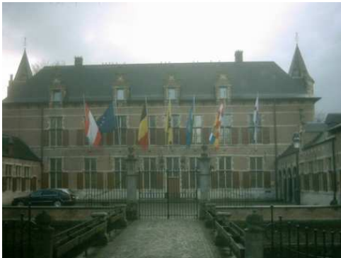
Het toekomstige gemeentehuis van Ekeren?

Fractie Vlaams Belang in Vlaams Parlement dient voorstel tot decreet in met als doel de realisatie van de gemeente Ekeren.